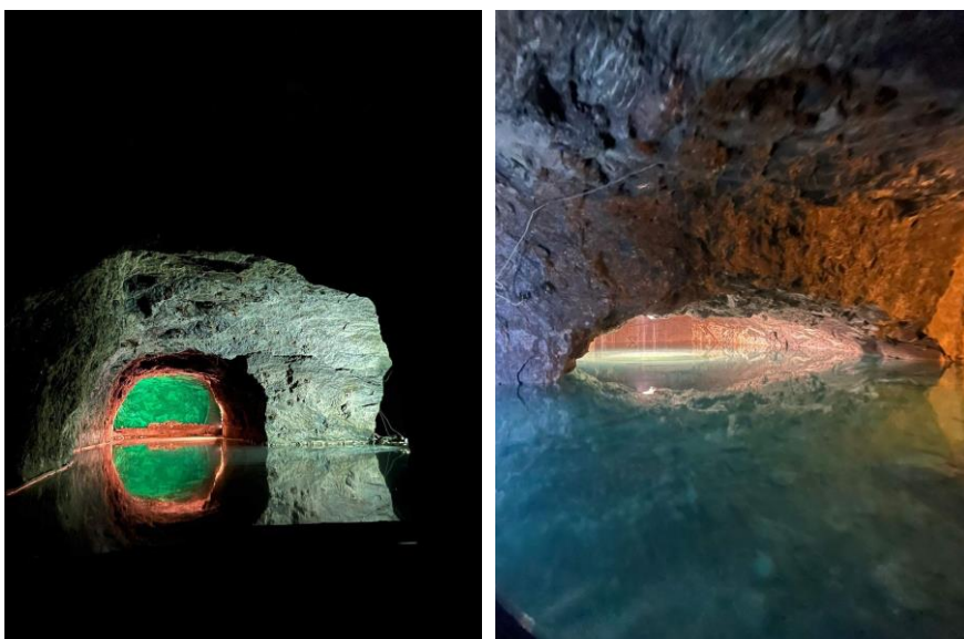
Foto: podzemní jezero v Seegröte