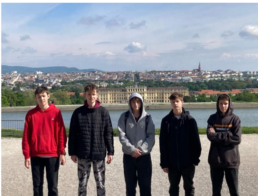
Žáci 9. ročníku, za nimi zámek Schönbrunn

Na jedenáctou hodinu jsme měli objednanou prohlídku Seegröte nedaleko obce Hinterbrühl a projíždku na loďkách po největším evropském podzemním jezeře. Prohlídka bývalého sádrovcového dolu s největším podzemním jezerem v Evropě mnohé natolik zaujala, že zapomněli mluvit. Průvodce, bývalý učitel z Ameriky, měl pro mnohé natolik osobitý projev a dokázal žáky zaujmout, že mu mnozí po celou prohlídku viseli na rtech a ani nedutali. Ten pak děti nadšeně chválil s tím, že ačkoliv s sebou máme 48 žáků, takhle hodnou a pozornou skupinu dlouho nezažil.