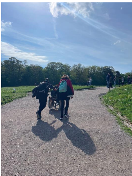
Cesta na Gloriette (areál zámku Schönbrunn )