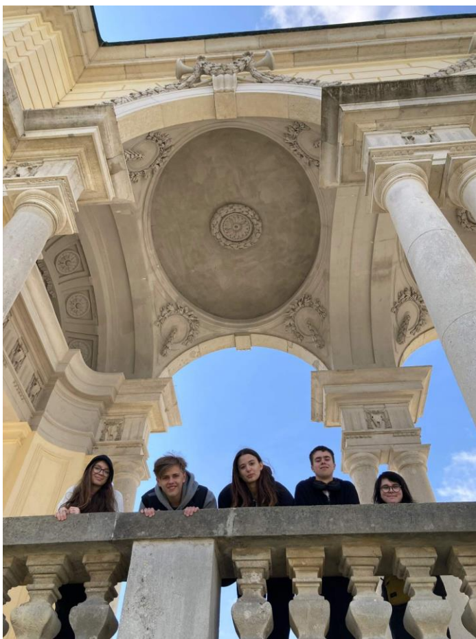
Gloriette nad zámkem Schönbrunn

Druhý den jsme se sešli na snídani v půl osmé ráno. Po posilnění se lívanci z lívancového stroje jsme nastoupili do autobusu a vyrazili směr Schönbrunn . Letní sídelní rezidence panovnického rodu Habsburků se 1441 pokoji většinu z nás zaujala. Na schodech v zadní části zámku jsme si ještě nechali udělat hromadnou fotku a prošli se až ke Gloriette , odkud byl pěkný výhled nejen na samotný zámek, ale i na velkou část Vídně. Potěšilo nás, když se mnozí sháněli po dominantě města - Stephansdomu , kterou si z předešlého dne vepsali do paměti. Od Gloriette ale vidět nebyl, ačkoliv s jeho úctyhodnou výškou věží ční do dálky. Nám zůstal skryt za lesem. Přeci jen jsme se nacházeli v západní části města a do jeho samotného středu jsme se vraceli až odpoledne.