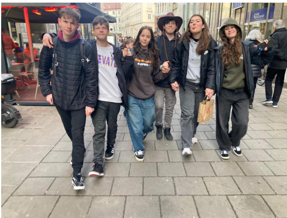
žáci 9. ročníku, centrum Vídně

Posledním bodem programu prvního dne pak byla návštěva Stephansdomu a jeho nejbližšího okolí. V jeho těsné blízkosti pak žáci vzali útokem obchod se slavnými místními oplatkami Manner a na sraz se vraceli ověšení růžovými taškami naplněnými touto známou rakouskou pochutinou.